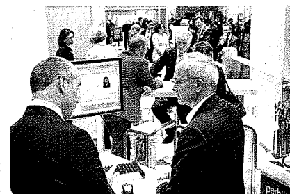
Treffpunkt: Zukunft Komune

Mit dem gebündelten und attraktiveren Angebot im Verbund lockt die Messe 2011 bestimmt noch mehr Besucher an.